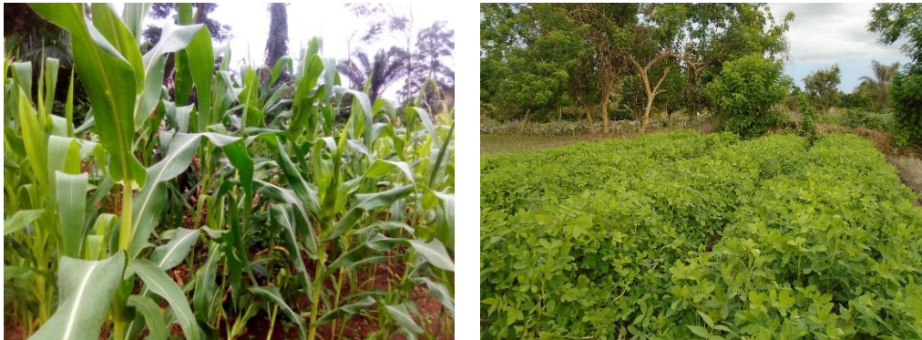
Parcelles de maintenance variétale de maïs et arachide

Ces parcelles de maintenance ont permis d'obtenir des semences souches qui permettront au secteur privé de lancer la campagne suivante le programme de maintenance des espèces concernées : maïs (500 épis), riz (500 panicules) et arachide (200 lignées).