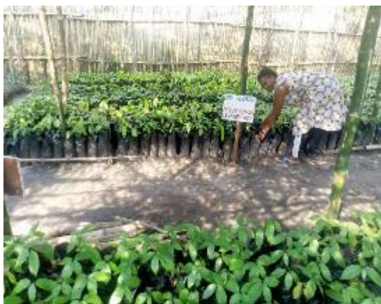
Figure 1 : Pépinière d'espèce fruitière et pérenne