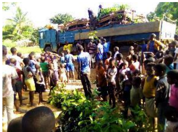
Figure 2 : Distribution de plantules auprès des bénéficiaires