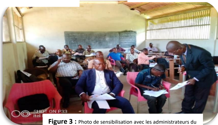
Figure 3 : Photo de sensibilisation avec les administrateurs du territoire et STD de Lisala

Après avoir lu quelque article des lois et dessous, tous les participants ont fait une demande verbale celle d'avoir lesdites lois en endure :